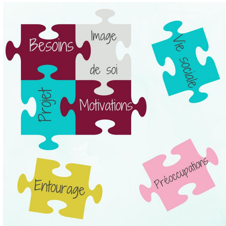
Education thérapeutique muco CFTR